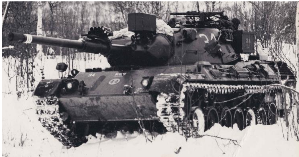
Leopard 1 i Øvelse Kald Vinter i 1974.

mange forskjellige varianter av Leopard. Norge kjøpte Bergepanzer og har siden produsert lokalt noen mineryddere på Leopard chassis.