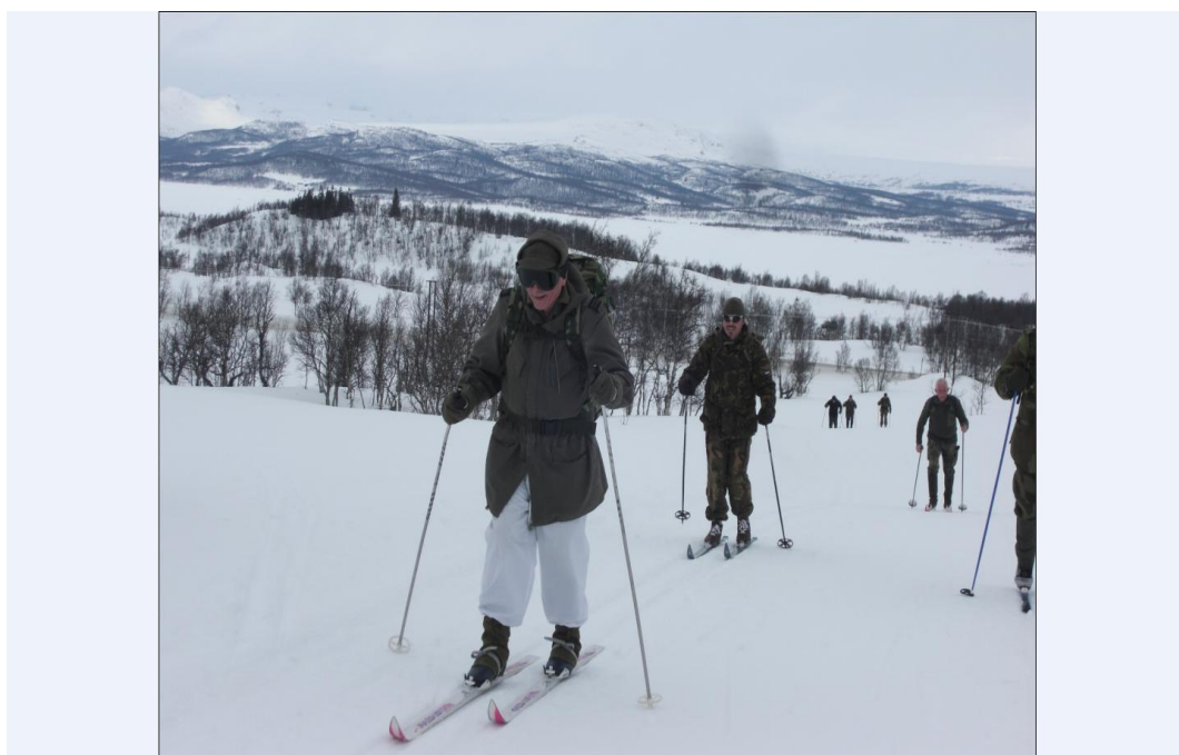
Deltagerne på årets marsj på vei opp fra Skinnarbu. Møsvatn i bakgrunnen.