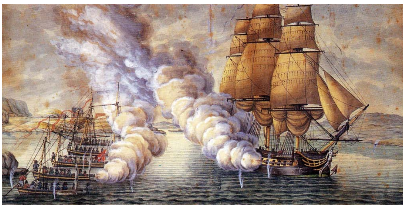
Slaget mellom fregatten Tartar og fire norske kanonjoller samt en kanonsjalupp i 1808.